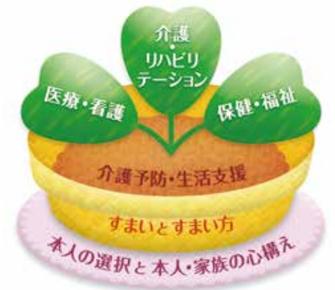
地域包括ケアのイメージ 「植木鉢図 2016」

今までは、在宅医療でも治療に重点を置いていましたが、これからの在宅医療は、「治し支える医療」となっていくと思います。患者さまにとっての支えとは、医療・介護の面だけでなく、何よりご家族からの支えが大切です。またそのご家族を支えるために行政や地域、ケアマネジャー等が協力し、包括的なケアを実践していくことが重要と考えています。